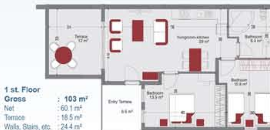
Type 2 Block 1 / 4

2 Bedrooms, Living room-open plan kitchen, Bathroom, Terrace