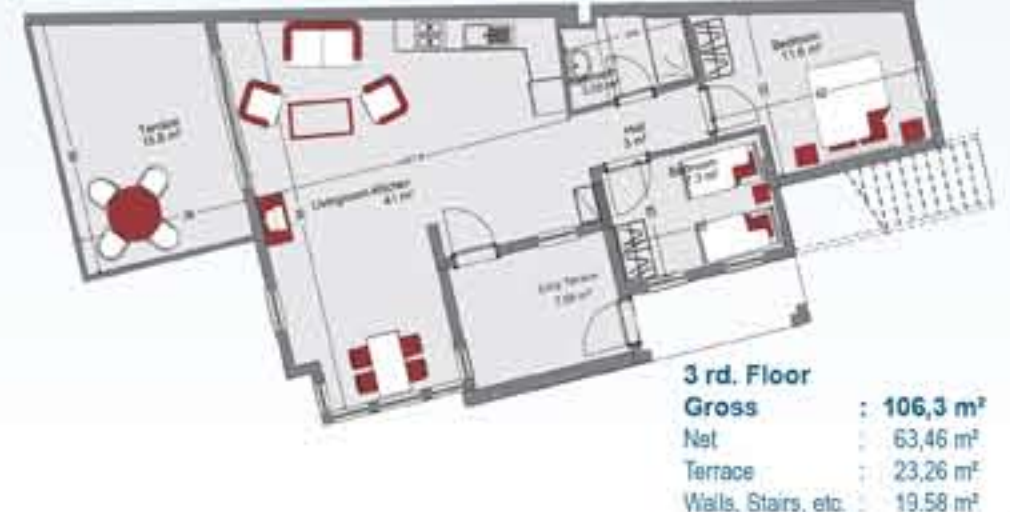
Type 5 Block 9 / 8 , Block 12 / 7 Penthouse

2 bedrooms, Living room-open plan kitchen, Bathroom, Terrace